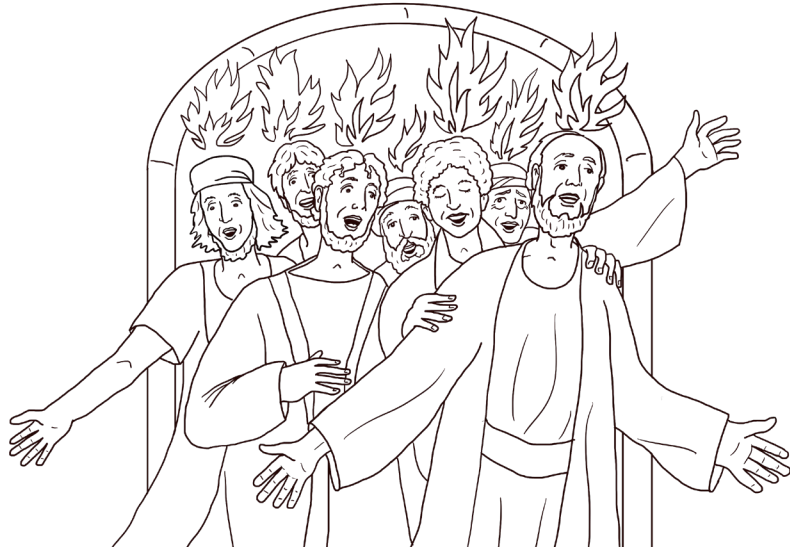
Llanwyd y disgyblion nes gorlifo.

Mae'r disgyblion yn cuddio rhag y tyrfaeodd yn Jerwsalem, nes i'r Ysbryd Glân eu llenwi ac maen nhw'n rhuthro i'r strydoedd i bregethu.